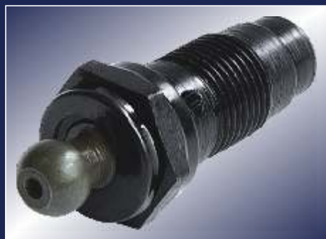
Опора гидравлическая рычага клапана мод. 21214-1007160