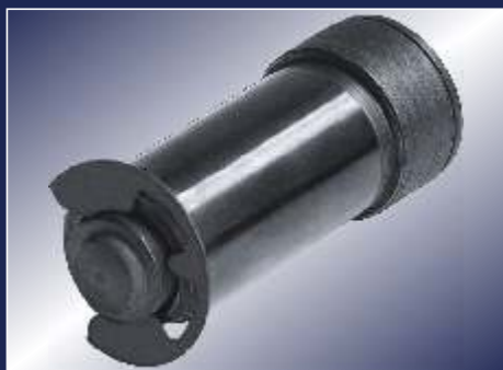
Гидравлические натяжители цепи мод. 406.1006100-10 406.1006100-20